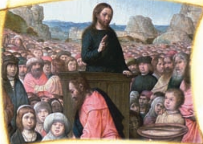
MULTIPLICACIÓN DE LOS PANES Y LOS PECES. Juan de Flandes . Del oratorio de Isabel la Católica, hoy en el Palacio Real. Madrid. Patrimonio Nacional.